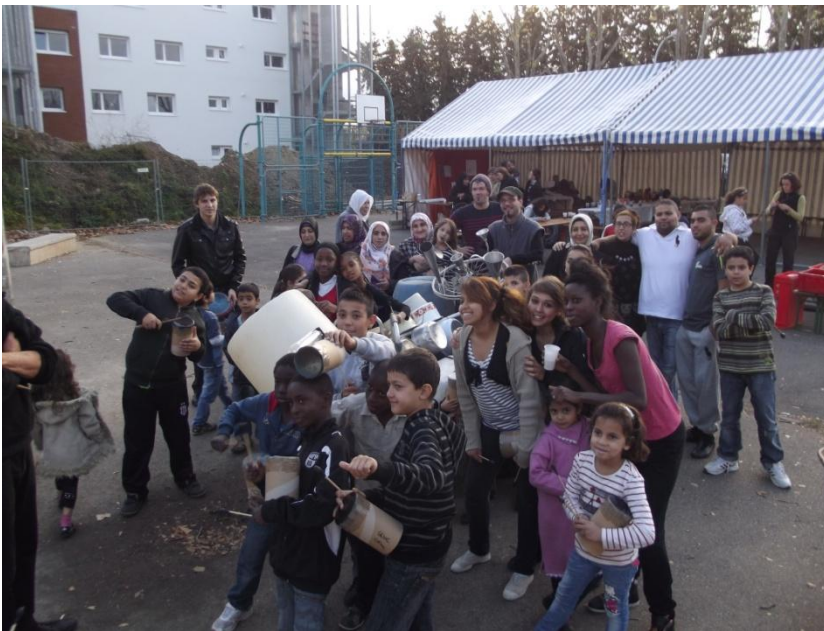
Journée quartier propre

Dans ce contexte d'évolution et d'amélioration du cadre de vie, d'autres temps sont organisés avec les habitants pour permettre une appropriation de ce « nouveau » quartier et favoriser le vivre ensemble (journées « quartier propre », fête des voisins, construction d'une maquette du quartier support de l'expression des habitants...).