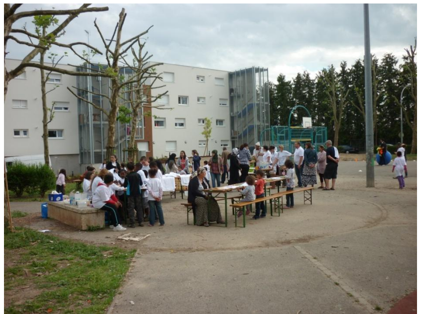
Fête des voisins